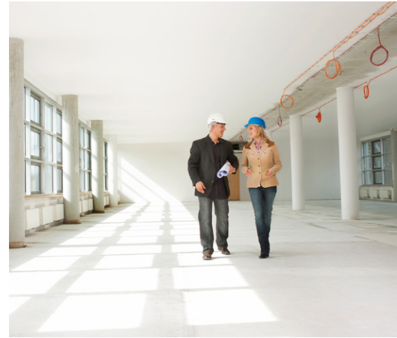
Nincs szükség internetes kapcsolatra a felszerelés során.